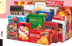
詰め合わせイメージ